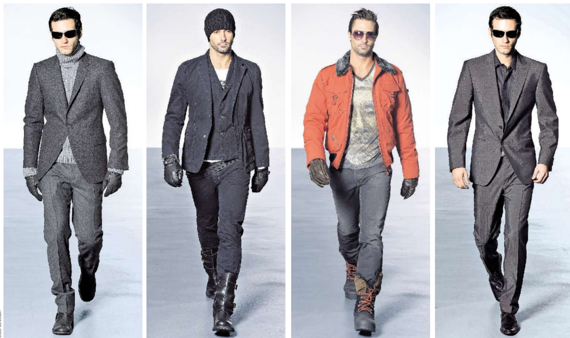
Aktuelle Mode der Marke Strellson: Mit eigenen Läden will der Modehersteller Holys seinen Marken zusätzlichen Umsatz verschaffen.